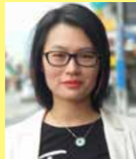
Crystal Pan Chinese Liaison